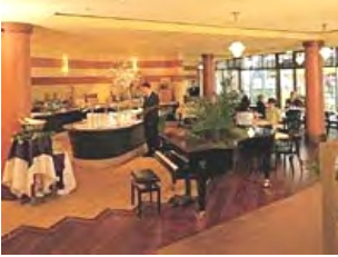
Restaurant Free Flow Bereich